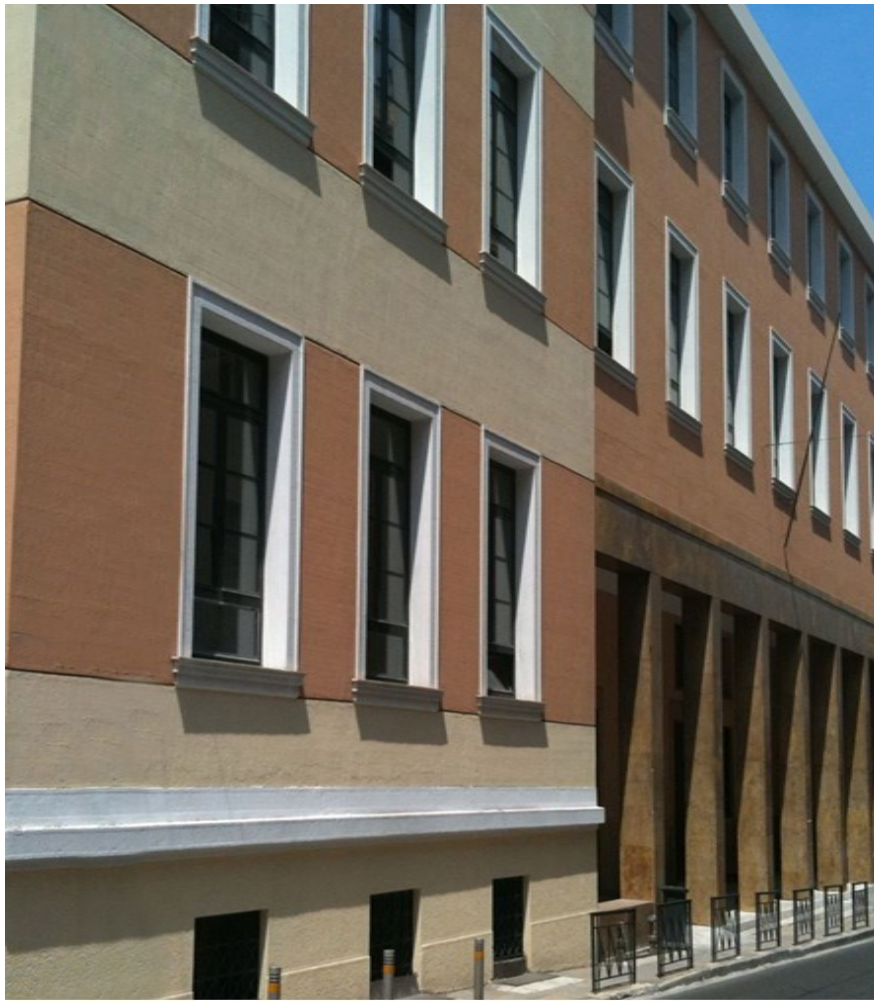
Νομική Σχολή Σόλωνος 57.