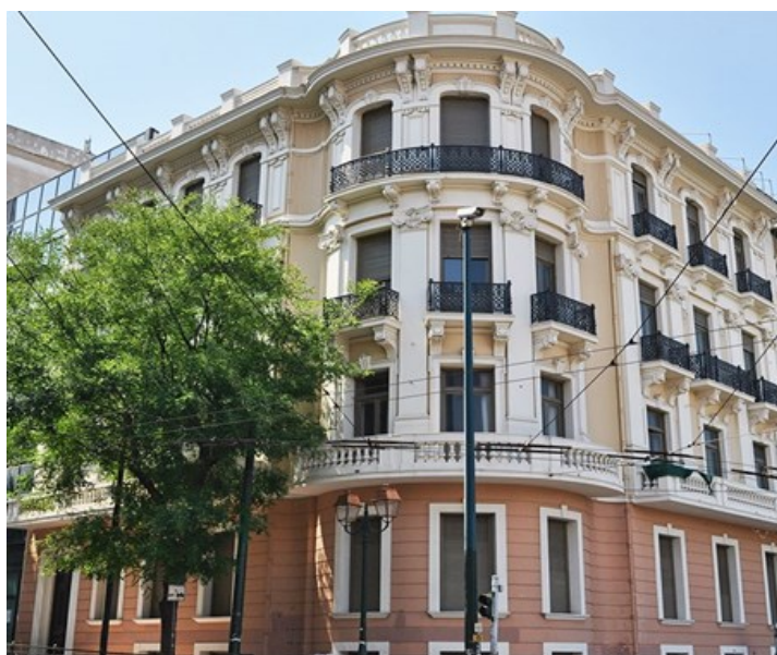
Η φωτογραφία είναι το κτήριο όπου συστεγάζονται η Γραμματεία της Νομικής Σχολής, τα γραφεία των Καθηγητών και τα εργαστήρια των Τομέων, ( Ακαδημίας 47 και Σίνα )

Εκ μέρους όλων των μελών του διδακτικού και διοικητικού προσωπικού, σας συγχαίρουμε και σας καλωσορίζουμε στο Πρόγραμμα Μεταπτυχιακών Σπουδών.